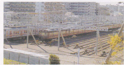
大阪市交通局 東吹田検車場