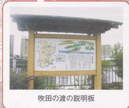
吹田の渡の説明板