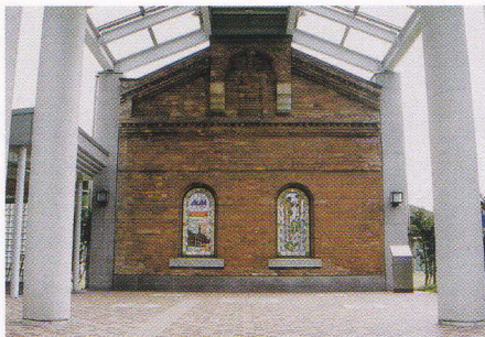
アサヒビール吹田工場のゲストハウス