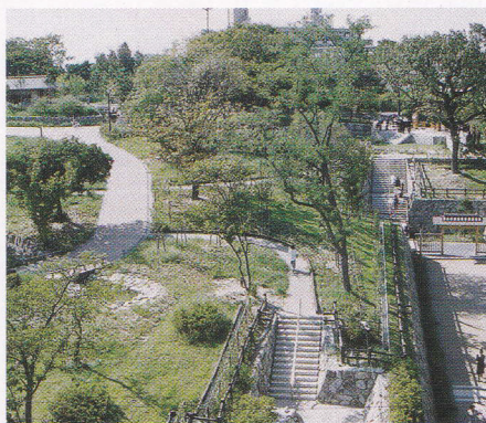
片山公園東口 城をイメージしてつくられています

多様な庭園、広場、滝、水路、池、遊具を配置した公園です。園内の水路は子どもが遊べます。平和のばら園やモニュメントなど見所いっぱい。公園周辺には中央図書館、片山市民体育館、片山市民プール、総合福祉会館など多くの公共施設が集まる健康と文化の拠点です。