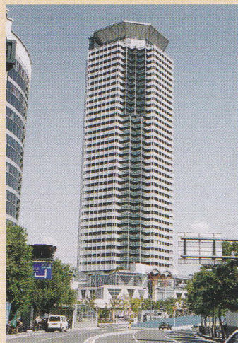
メロード吹田1番館

1996(平成8)年3月にオープンした1番館は高さ127mで、吹田一の高さです。最上の38階は見晴らしのよいレストラン、屋上は緊急時のヘリポートになっています。