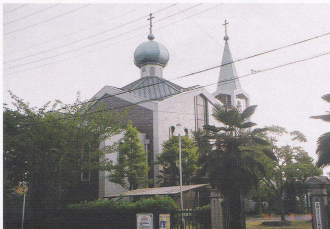
大阪ハリストス正教会