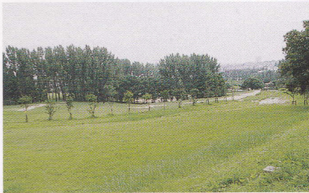
自然豊かな千里北公園