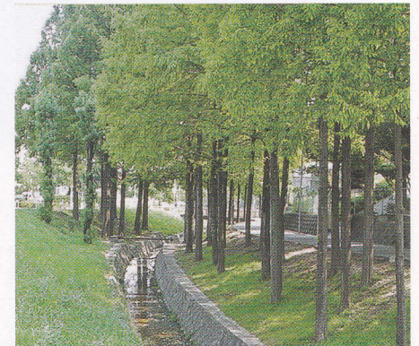
メタセコイアが美しい景観を作っています