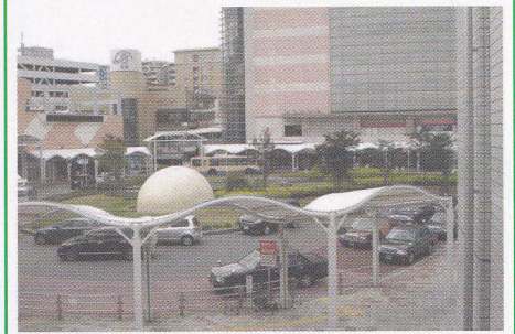
阪急北千里駅前とディオス北千里

千里ニュータウンの開発で生まれた北千里地域は、今では街路樹・住宅内の樹木など、みどり豊かな閑静なまちなみを形成しています。北千里駅前には1967(昭和42)年に阪急電車開通後、北のセンターとして発展してきました。そして1994(平成6)年、商業施設は「ディオス北千里」に生まれ変わりました。北千里駅には世界に先駆けて自動改札機が設置されました。その技術を顕彰する表示板が改札内側にあります。