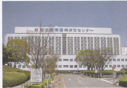
国立循環器病研究センター

日本最先端の医療機関です。2018(平成30)年度にJR岸辺駅前へ移転予定です。