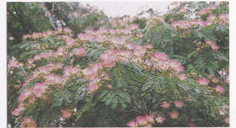
かつて咲き誇ったネムの木の花

青山公園正面・柳橋たもつには、枝葉を大きく広げたネムの木がありました。5月中旬から6月頃にはこの地域のシンボルのように、見事な花を咲かせていたので、道路にこの愛称がつけられました。